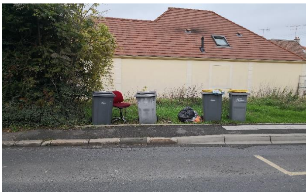
Ci-dessus : rue de la République