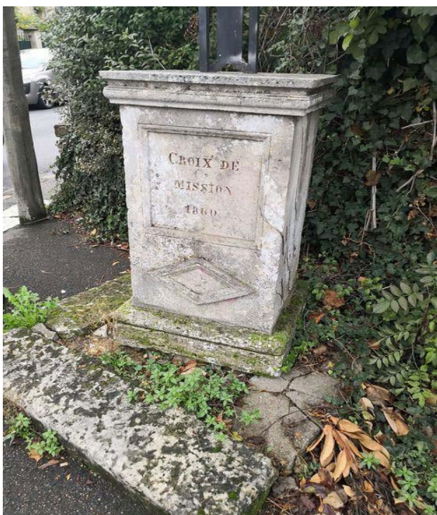
Ci-dessus : calvaire