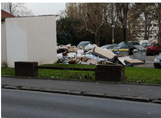
Ci-dessus : résidence des Fleurs